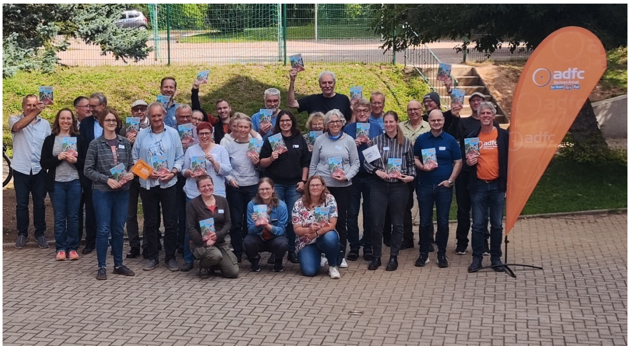
Die Mitglieder der Landesversammlung präsentieren die neue Broschüre.